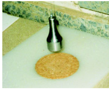
Abbildung 4: Der Fallkörper