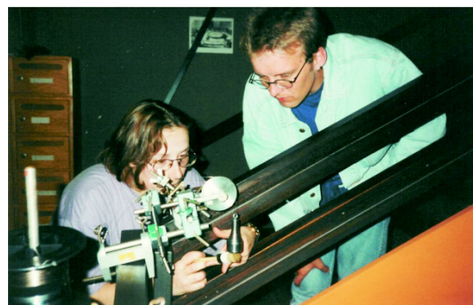
Abbildung 5: Vorbereitung zum Start